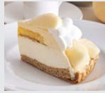
“岡山白桃”と アールグレイの ムースケーキパイ