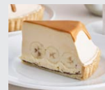
生キャラメルの バナナ塩カスタード クリームパイ