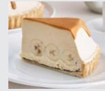
生キャラメルの バナナ塩カスタード クリームパイ