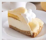
“岡山白桃”と アールグレイの ムースケーキパイ