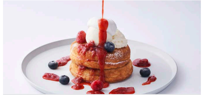
ベリーとクリームチーズの パンケーキ

1,750 (税込 1,925) drink set 2,350 (税込 2,585)