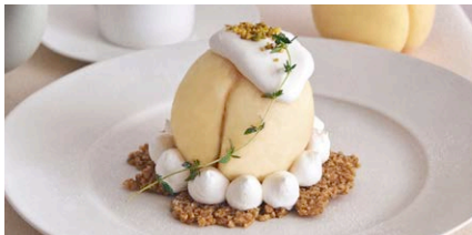
まるごと“岡山白桃”の レアチーズケーキ

1,200 (税込 1,320) drink set 1,800 (税込 1,980)