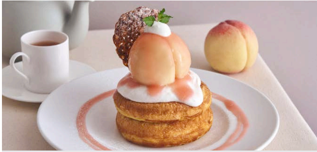
まるごと“岡山白桃”とミルククリームのパンケーキ

1,750 (税込 1,925) drink set 2,350 (税込 2,585)