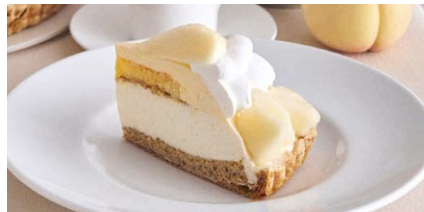
“岡山白桃”とアールグレイの ムースケーキパイ

1,200 (税込 1,320) drink set 1,800 (税込 1,980)