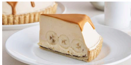
生キャラメルのバナナ塩カスタード クリームパイ

1,300 (税込 1,430) drink set 1,900 (税込 2,090)