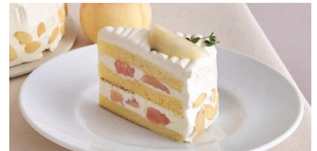
“岡山白桃”のショートケーキ

1,000 (税込 1,100) drink set 1,600 (税込 1,760)