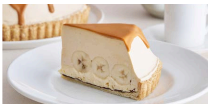
生キャラメルのパナナ塩カスタード クリームパイ

1,300 (税込 1,430) drink set 1,900 (税込 2,090)