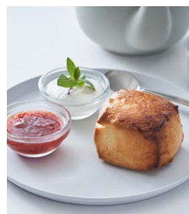
ピュアバタースコーン Pure butter scone

650 (税込 715) drink set 1,250 (税込 1,375) +ラムレーズン +50 (税込 55)