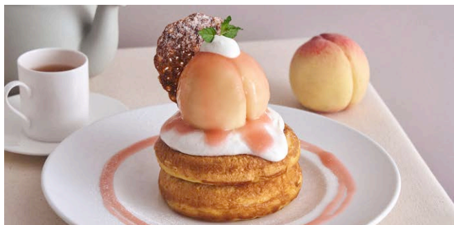
まるごと“岡山白桃”とミルククリームのパンケーキ

1,750 (税込 1,925) drink set 2,350 (税込 2,585)