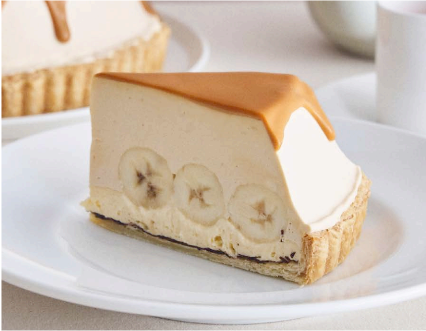
生キャラメルの バナナ塩カスタードクリームパイ Caramel banana salted custard cream pie

ひとつひとつの素材をしっかりと感じられる、 シンプルでまっすぐなおいしさのデザートです。