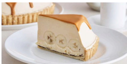
生キャラメルのバナナ塩カスタード クリームパイ

1,300 (税込 1,430) drink set 1,900 (税込 2,090)