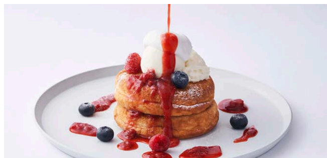
ベリーとクリームチーズの パンケーキ

1,750 (税込 1,925) drink set 2,350 (税込 2,585)