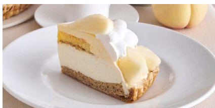
“岡山白桃”とアールグレイの ムースケーキパイ

1,200 (税込 1,320) drink set 1,800 (税込 1,980)