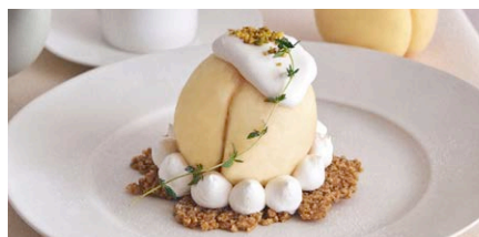
まるごと“岡山白桃”の レアチーズケーキ

1,200 (税込 1,320) drink set 1,800 (税込 1,980)