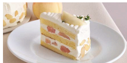
“岡山白桃”のショートケーキ

1,000 (税込 1,100) drink set 1,600 (税込 1,760)