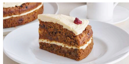
くるみとレーズンの キャロットケーキ