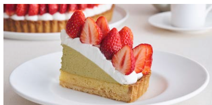
長野県産夏いちごとピスタチオの リッチタルト

1,300 (税込 1,430) drink set 1,900 (税込 2,090)