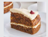
くるみとレーズンの キャロットケーキ パイ