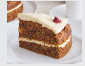
くるみとレーズンの キャロットケーキ パイ