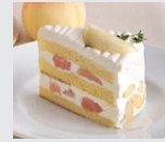
“岡山白桃”の ショートケーキ パイ