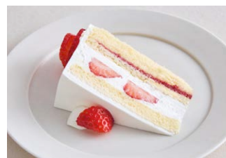
“朝摘み完熟紅ほっぺ”いちごの ふんわり<生>ショートケーキ 'Bani Hoppe' strawberry shortcake