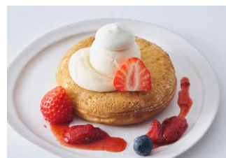
ベリーとクリームチーズの 1段パンケーキ Berry & creamcheese pancake [+200(税込220)]