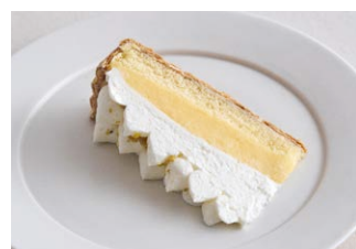
“大長レモン”のレモンパイ Lemon pie from Ocho Lemons