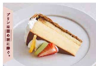
プリンアラモードパイ Pudding a la mode pie