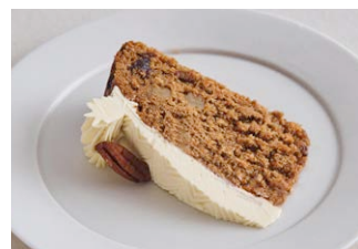
くるみとレーズンの キャロットケーキ Walnut and raisin carrot cake