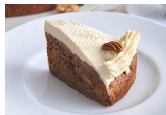
くるみとレーズンの キャロットケーキ Walnut and raisin carrot cake