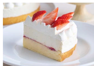
“朝摘み完熟紅ほっぺ”いちごの ベイクド&レア<生>チーズケーキ 'Bani Hoppe' strawberry baked & rare cheesecake