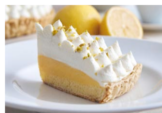
“大長レモン”のレモンパイ Lemon pie from Ocho Lemons