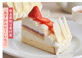
“あすカルビー”いちごの ベイクド&レア<生>チーズケーキ Asuka Ruby' strawberry baked & rare cheesecake