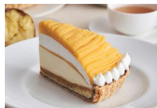
“蜜芋”づくしのモンブランパイ Sweet potato Mont Blanc pie