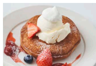
ベリーとクリームチーズの 1段パンケーキ Berry & creamcheese pancake [+200(税込220)]