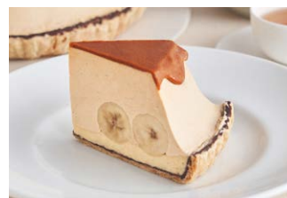
生キャラメルのパナナ 塩カスタードクリームパイ Caramel banana salted custard cream pie