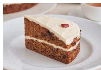
くるみとレーズンの キャロットケーキ Walnut and raisin carrot cake