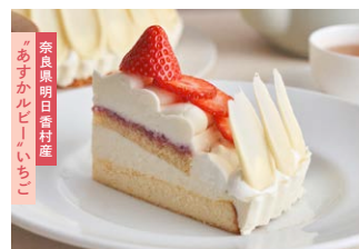
“あすカルビー”いちごの ベイクド&レア<生>チーズケーキ Asuka Ruby' strawberry baked & rare cheesecake