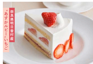
“あすカルビー”いちごの ふんわり<生>ショートケーキ 'Asuka Ruby' strawberry shortcake

下記のケーキ写真は「フルサイズ」です。 実際のご提供は、すべて「ハーフサイズ」になります。