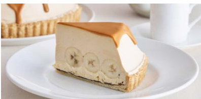
生キャラメルのパナナ 塩カスタードクリームパイ