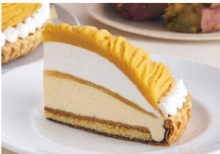
“蜜芋”づくしのモンブランパイ