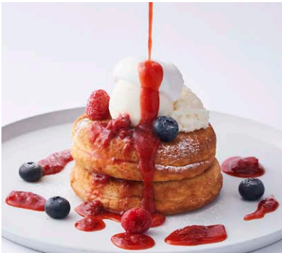
ベリーとクリームチーズの パンケーキ