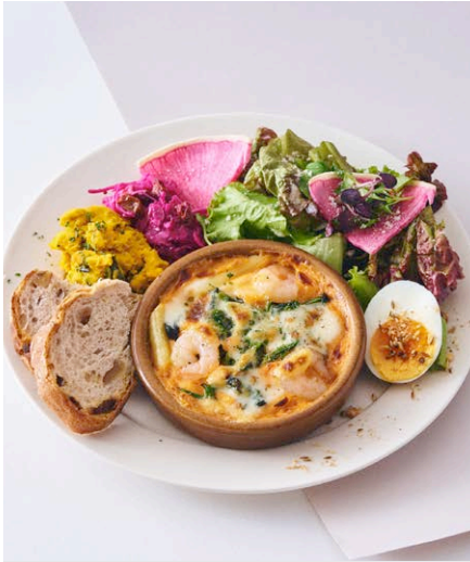
海老とモッツアレラの ビスクグラタン