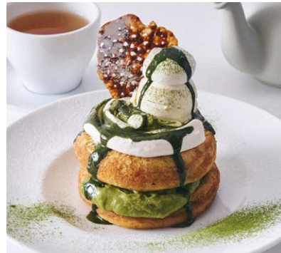
福岡産八女茶と マスカルポーネ クリームのパンケーキ