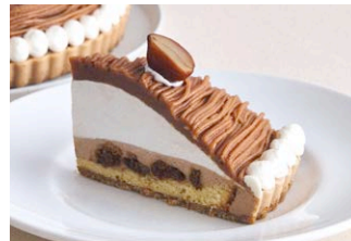
フランス産栗のモンブラン