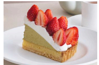
いちごとピスタチオのタルト