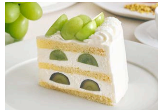
完熟シャインマスカットの ショートケーキ