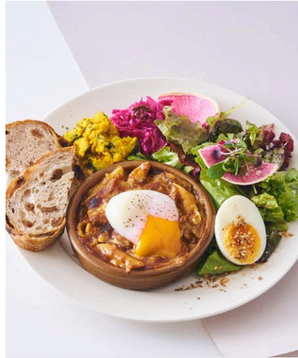
温泉たまごの ビーフシチューグラタン