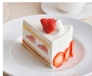
“朝摘み完熟紅ほっぺ”いちごの ふんわり<生>ショートケーキ ‘Beni Hoppe’ strawberry shortcake