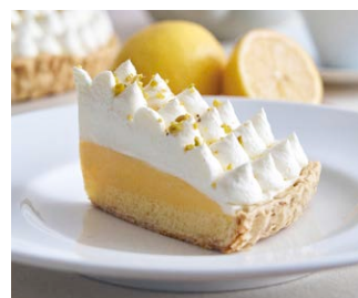
“大長レモン”のレモンパイ Lemon pie from Ocho Lemons