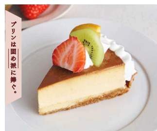
プリンアラモードパイ Pudding a la mode pie