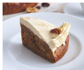
くるみとレーズンの キャロットケーキ Walnut and raisin carrot cake